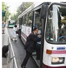
Segregated bus (archives)